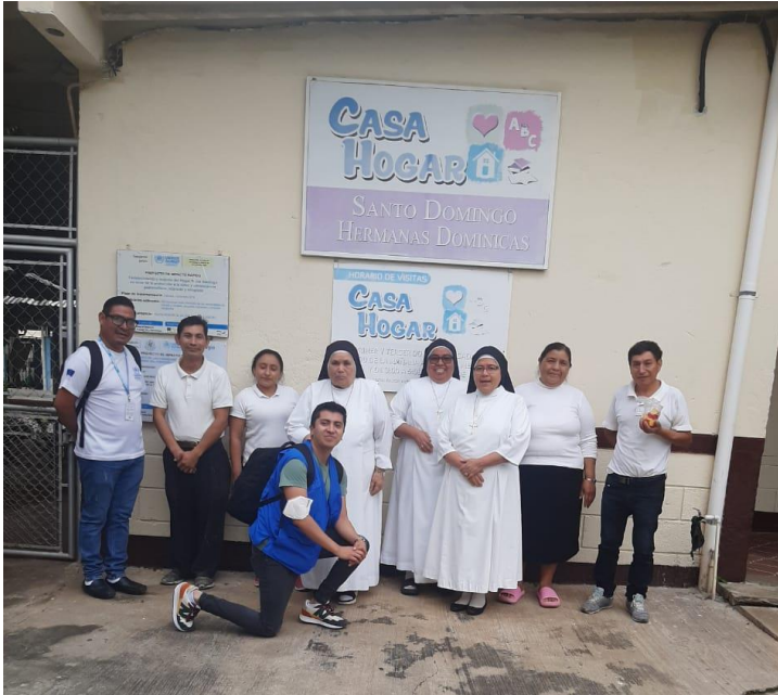
L'équipe de Casa Hogar,

accompagnée de deux jeunes hommes (portant un sac à dos) qui ont réalisé l'atelier